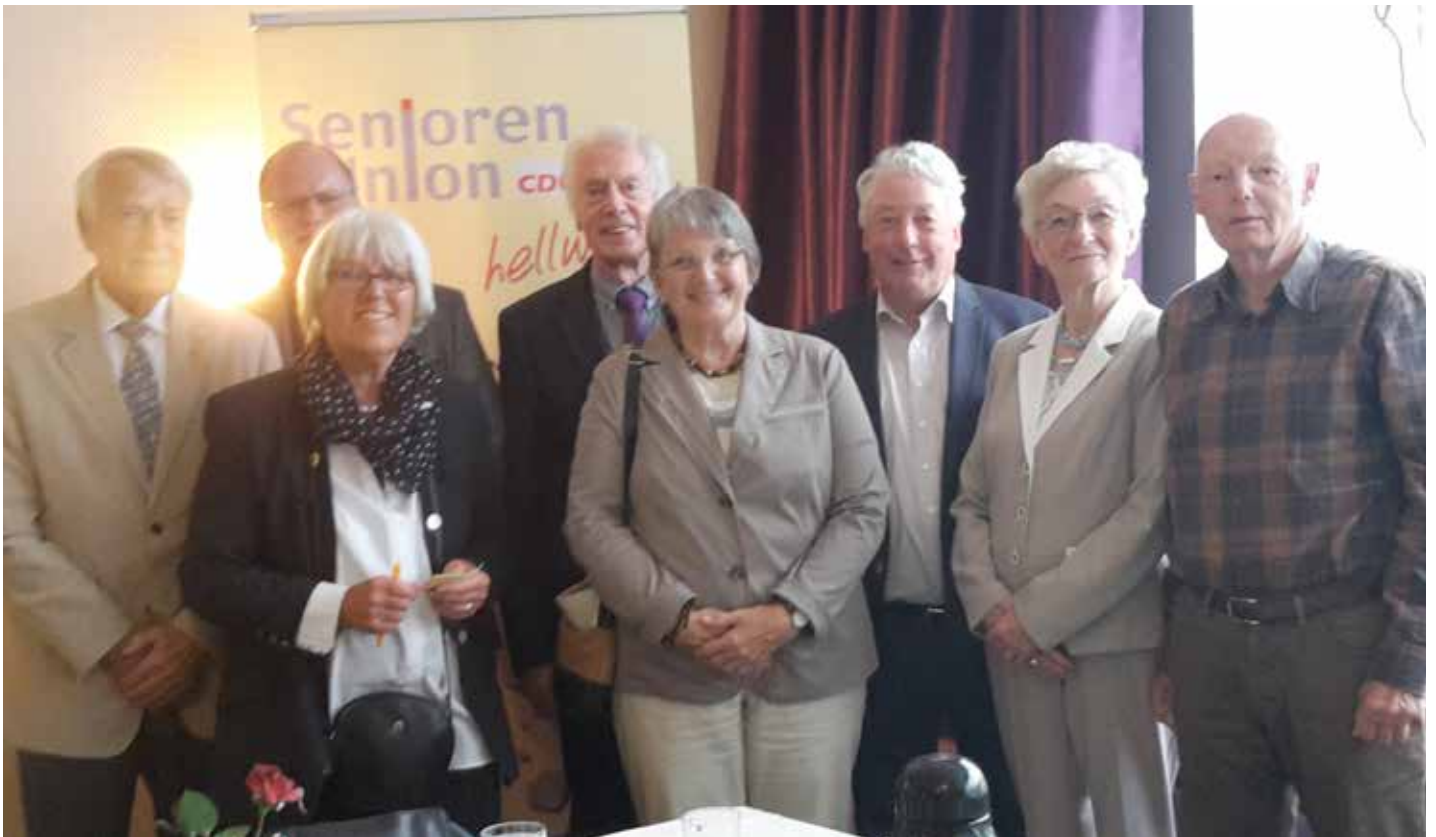
Der Vorstand der Senioren-Union Nordfriesland